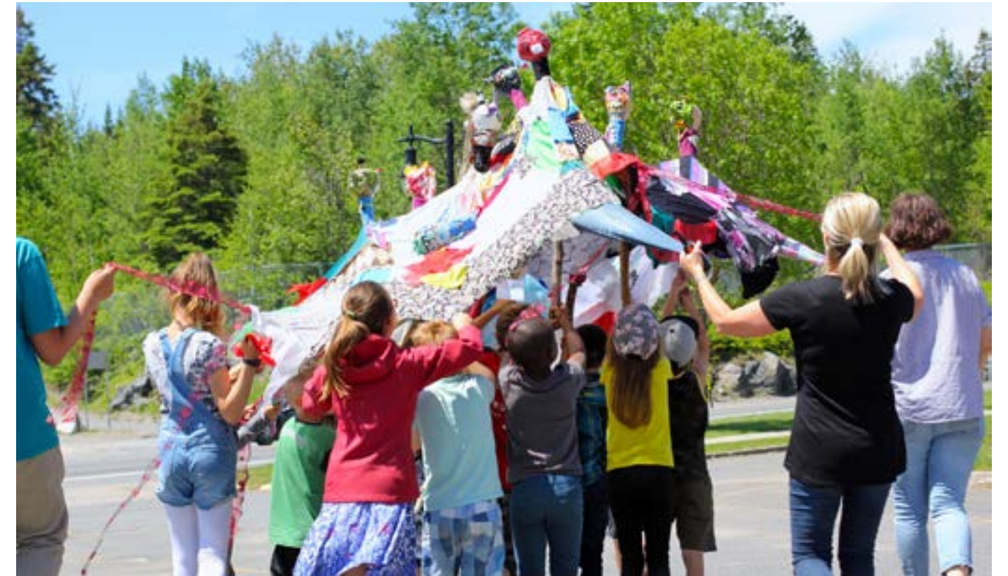
ArAMiS à l'école Notre-Dame d'Alma. Photo de Melissa Corbeil, 2019.

Par ses projets particuliers, Langage Plus souhaite participer activement au développement professionnel des artistes qu'il accompagne. En plus de pouvoir mener un projet d'envergure sans s'encombrer des charges administratives, de la coordination ou de la recherche de financement, l'artiste tirera plusieurs bénéfices à sa collaboration avec le centre.