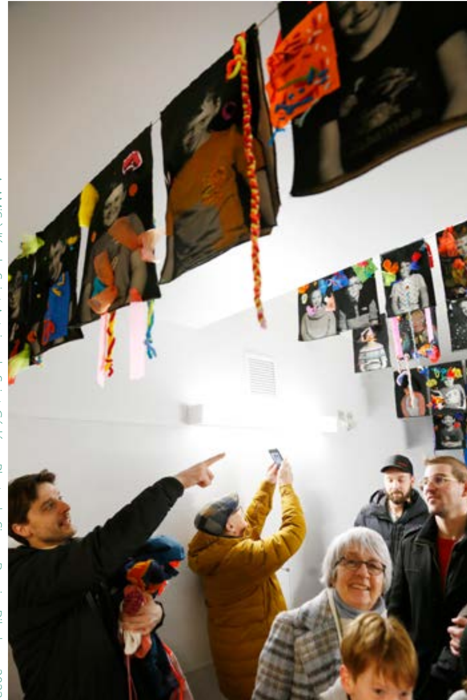
ARAMIS à l'école Saint-Antoine de Saint-Gédéon.

Le comité de sélection veille à rester souple sur le concept d'émergence, puisque les artistes, qui occupent souvent plusieurs fonctions professionnelles, font de longues études ou s'engagent dans une vie familiale, prennent davantage de temps avant d'acquiescer un statut d'artiste établi. Aussi, il souhaite favoriser des projets pro-familles dans son prochain appel de dossiers et faciliter les conciliations multiples.