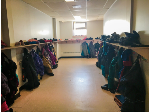
1 Espace des casiers